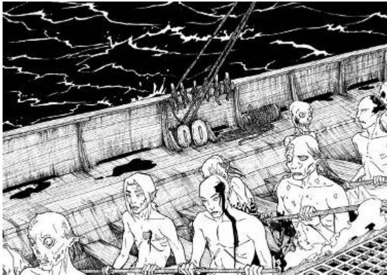
La galère des vampires damnés