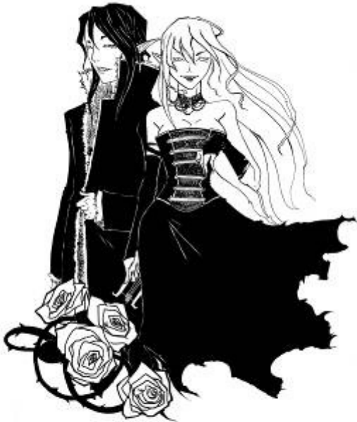
La famille des bellatres et celle des musiciens