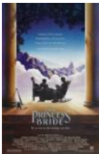
The Princess Bride (Princess Bride) 1987