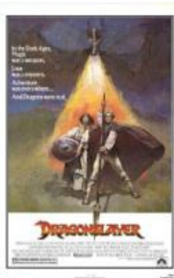
The Dragonslayer (Le dragon du lac de feu) 1981