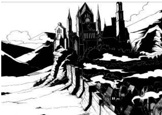
Le village du clan : Gaskel