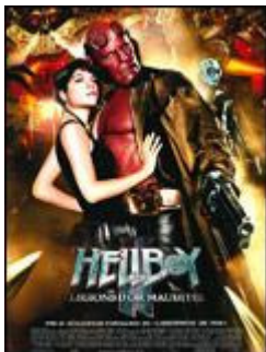
Hellboy 2 (2008) Les légions d'or maudites