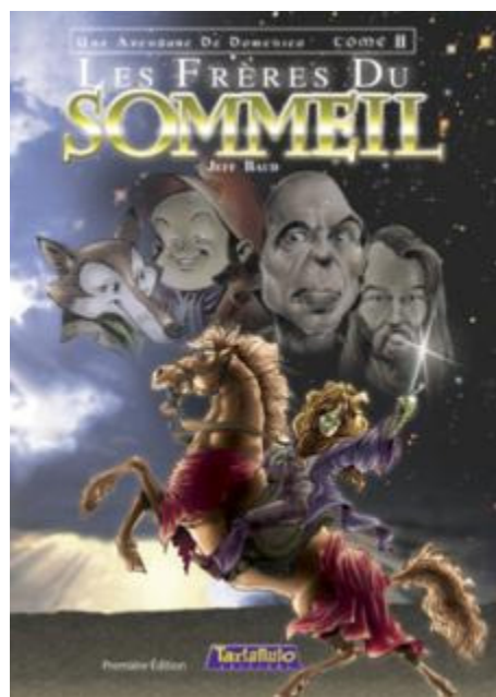
Une Aventure de Doménico Tome 2 - Les Frères du Sommeil Scénario et dessin : Jeff Baud Couleur : Sylviane Sidoit

Que se passe-t-il lorsqu'un nain des montagnes, accompagné de son inséparable chouette, lorsqu'un cheyenne et un renard érudit se rassemblent pour discuter d'un vieux message trouvé dans une bouteille au fond d'un étang ? Que se passe-t-il lorsqu'ils découvrent une énigme alchimique sur le parchemin, testament du moine Nikobus Kéton. Ce dernier a disparu depuis plus de mille ans et le message fait allusion à un précieux médaillon magique, que prétend détenir une vulgaire marchande de souvenirs. Et en quoi ceci intéresse-t-il vivement trois sorcières qui ont eu vent de la chose ? Quel motif est assez fort pour rassembler tout ce beau monde dans l'immense ville de DINGOBART un jour de marché ? Tous ses gens aussi dissemblables ne feront pas forcément bon ménage, et qui sera assez rusé, assez fort pour percer le secret de Nikobus Kéton ?!