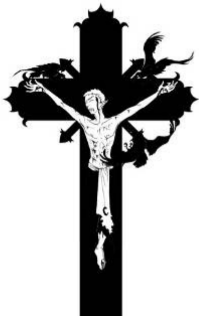
Un vampire crucifié par l'inquisition