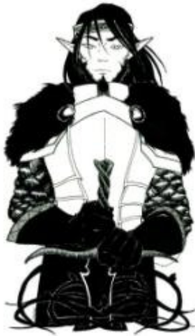
La famille des Notables (le seigneur Vénéтин)