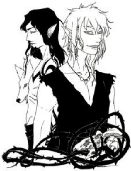
Famille vampirique des druides et des fous