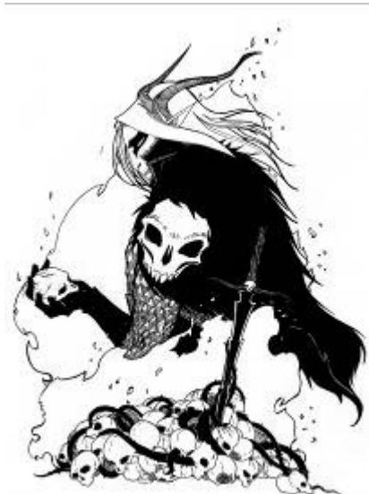
Ikan « la bête » le sinistre seigneur du clan de la lune bleue