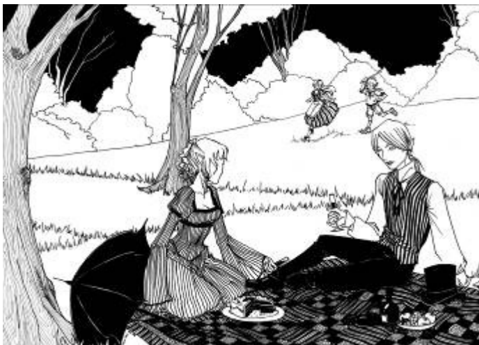
Pique nique d'une nuit d'été