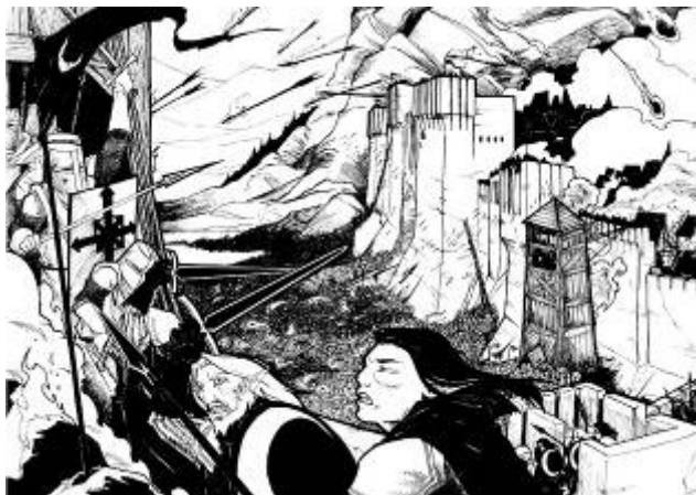
La prise de Gaskel

Aucun problème tant que la publicité ne nuit pas à la lecture.