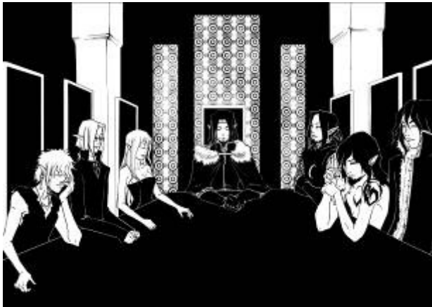
une réunion des chefs de famille