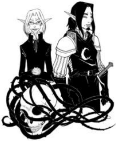
La famille des Savants et celle des guerriers